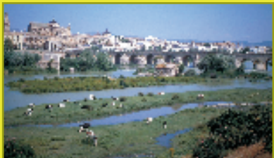
Andalucía: Término Municipal de Córdoba