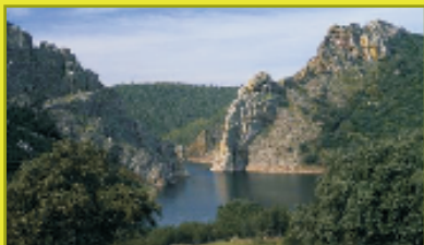
Extremadura: Valle del Alagón