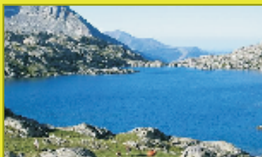
Midi Pyrénées: Valles de los Pirineos