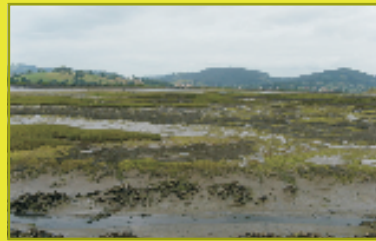
Cantabria: Parque Natural de Las Marismas de Santoña