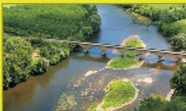
Aquitania: Cuenca fluvial del río Lizonne