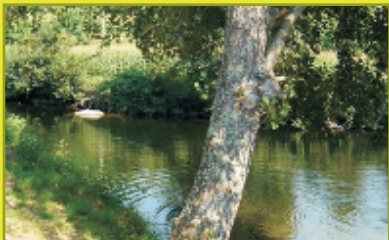
Norte de Portugal: Valle del Ave