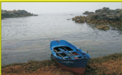
Galicia: Costa de Carnota

Los socios del proyecto realizarán los estudios climáticos en los siguientes enclaves de sus correspondientes territorios: