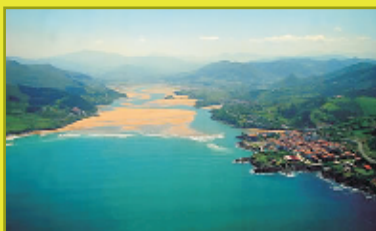
País Vasco: Reserva de Urdaibai